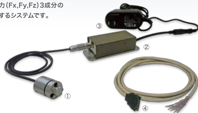
ビーエル・NANOセンサの構成部品

(注)このアナログ信号は検出時に貼られた歪ゲージの信号で、各軸の成分に対応しておりません。6成分への演算は、NANOセンサ変換器個々のキャリブレーション行列式により実施ください。