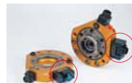
J16A, J16B 5A×16本(JMコネクタ) ※2 ※5