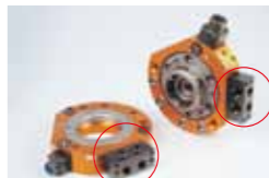
P3WA, P3WB Rc3/8×2本