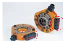
P18A, P18B Rc1/8×4本