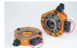
P14A, P14B Rc1/4×2本