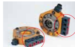
P38A, P38B Rc3/8×4本