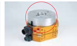
SA, SB 近接スイッチ2個内蔵レシストンの位置確認により着脱確認