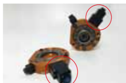
B15NA/B, B15PA/B(マスタのみ) B15DA/B(ツールのみ) B15NA/B NPN出力 B15PA/B PNP出力