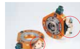
E50A, E50B アースコンタクト500A×1本