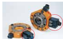
M10A, M10B 13A×10本(MSコネクタ) ※2 ※6