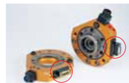
D15A, D15B 3A×15本 Dサブ15コネクタ (雌レセプタクル) ※4