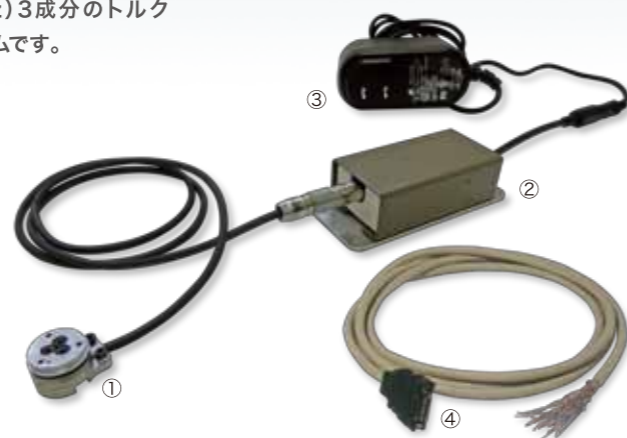
ビーエル・ThinNANOセンサの構成部品 ①変換器 ②増幅ユニット ③電源アダプタ ④出力コネクタ(PA:ケーブル5mまたはPS:出力コネクタのみを選択)

(注)このアナログ信号は検出時に貼られた歪ゲージの信号で、各軸の成分に対応しておりません。6成分への演算は、ThinNANOセンサ変換器個々のキャリブレーション行列式により実施ください。