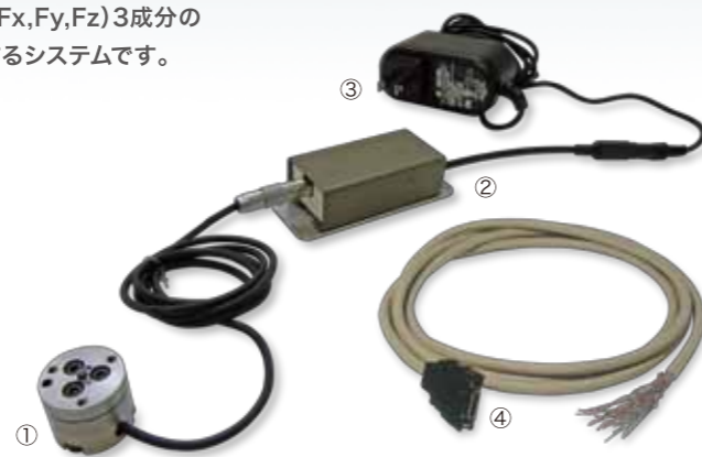
ビーエル・MICROセンサの構成部品 ①変換器 ②増幅ユニット ③電源アダプタ ④出力コネクタ(PA:ケーブル5mまたはPS:出力コネクタのみを選択)

追加プレートを取付けることにより、取付けボルトを円筒側面から締め付けることができます。